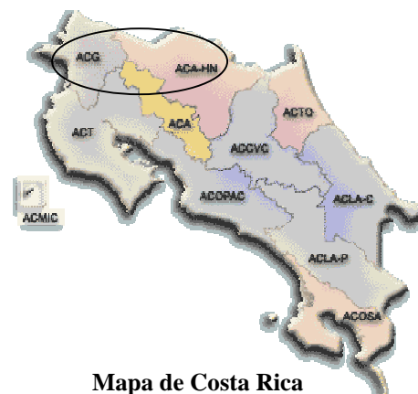
Mapa de Costa Rica