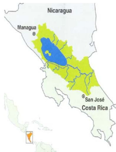
Figura 2. Área del Proyecto Procuenca

Por otra parte, existe una serie de proyectos e iniciativas para propiciar el desarrollo de la zona fronteriza, los cuales se relacionan directa e indirectamente con la promoción del turismo. Por ejemplo, Procuenca San Juan es un proyecto binacional orientado al manejo integral del recurso hídrico de la cuenca del río San Juan y su zona costera ejecutado por los gobiernos de Costa Rica y Nicaragua, que surgió en 1992 con la iniciativa del Plan de Acción Centroamericano para el Desarrollo Fronterizo e inició acciones en 1995 con recursos aportados por el PNUMA y la Unidad Sostenible y Medio Ambiente (UDSMA) de la OEA (Procuenca 2001).