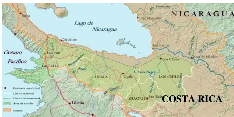
Figura 1: Mapa de ubicación del territorio de estudio